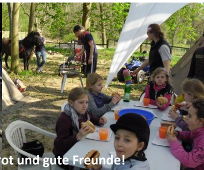
Lagerfeuer, Stockbrot und gute Freunde!

Natürlich nehmen die RANGER auch am umfangreichen Programm des Clubs teil. Wenn sie wollen. In der Disco kann sowieso nicht auf sie verzichtet werden. Bitte auf der Anmeldekarte die Teilnahme ankreuzen.