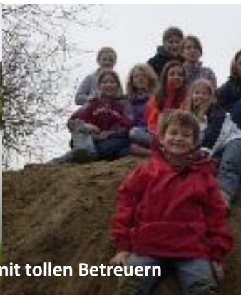
Angeln, grillen und Spaß mit tollen Betreuern